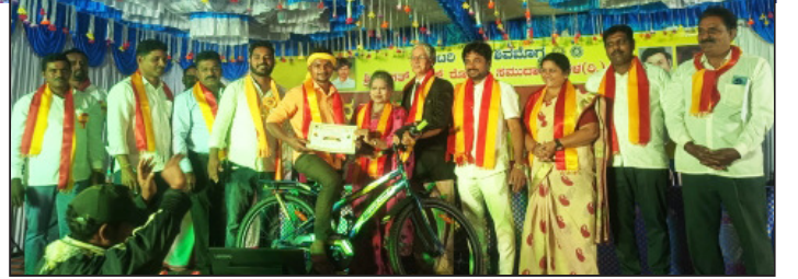
ಭಗತ್‌ಸಿಂಗ್ ಆರ್‌ಸಿಸಿ ಕುಂಸಿ ರಾಜ್ಯೋತ್ಸವ ಕಾರ್ಯಕ್ರಮದಲ್ಲಿ ಸೈಕಲ್ ಸ್ಪರ್ಧೆ ವಿಜೇತರಿಗೆ ನಮ್ಮ ಕ್ಲಬ್‌ನಿಂದ ಸೈಕಲ್ ಬಹುಮಾನ.