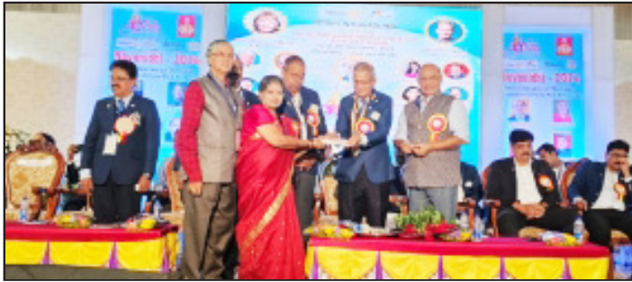
ಕಾರ್ಯದರ್ಶಿ ರೊ. ಎನ್.ಜಿ. ಉಷಾರವರು PHF Contribution ಗೆ 42000/- ಚೆಕ್ ನೀಡಿದರು.