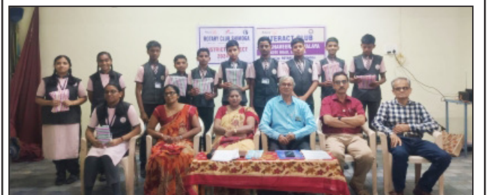
District Project Road Safety Essay Competition and Prize Distribution in Mahaveera Vidyalaya at Shivamogga