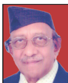
Nataraj D.S. 07 th Dec